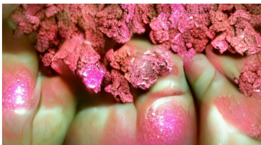
Andrea Khôra, BOLUS, Video Still, 2022.

Die digitale Transformation ist in unserer Gesellschaft allgegenwärtig und auch Künstlerinnen und Künstler beschäftigen sich längst mit der Macht von Algorithmen, Datenkonzentration oder Verschlüsselungsfragen. Am 27. und 28. Oktober sind im Berliner Theater im Delphi unter